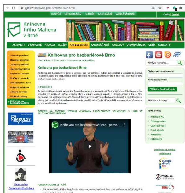
Ilustrace: landingpage webu úspěšného akceleračního projektu KpBB 3

Zjištění z projektu CIDES tak odpovídají žádoucímu trendu v českém i světovém knihovnictví, který byl realizací projektových aktivit podpořen v řadě českých knihoven.