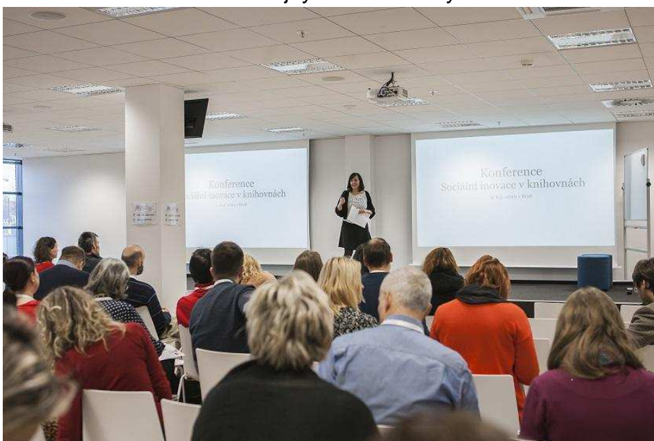
(ilustrace: Fotografie ze závěrečné projektové konference Sociální inovace v knihovnách 2020)

Centrum sociálních inovací ve veřejných knihovnických a informačních službách