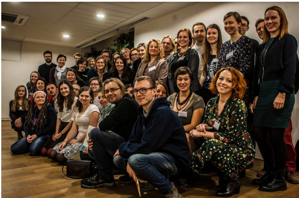
Ilustrace: Účastníci prvního dne Konference Sociální inovace v knihovnách, Brno, 2018

https://kisk.phil.muni.cz/komunitni-knihovna/evaluacni-zpravy-a-odborne-publikace