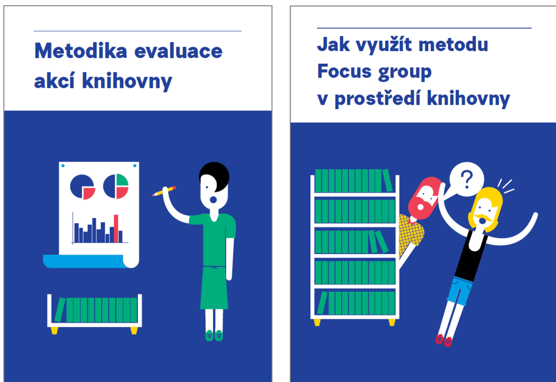
Obrázek 2 Úvodní stránky Metodiky evaluace akcí a Metodiky FS pro knihovny

(Dostupné na: https://kisk.phil.muni.cz/komunitni-knihovna/nastroje-a-metodiky )