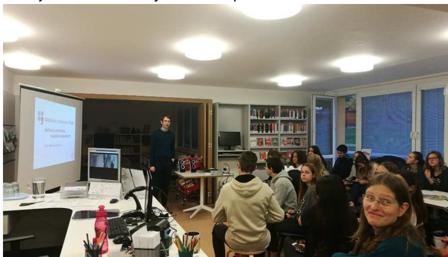
Foto: jeden z realizovaných workshopů deFacto

Aby workshopy mohly snadno přejímat i další knihovny, vznikla i interaktivní otevřená metodika. Díky ní mohou zapojené knihovny využít existující vzdělávací obsah, ale také si předávat zkušenosti a dále design workshopů zlepšovat. Workshopy dodnes (6/2020) prošlo přes 300 studentů a díky velmi dobré zpětné vazbě je můžeme považovat za úspěšné.