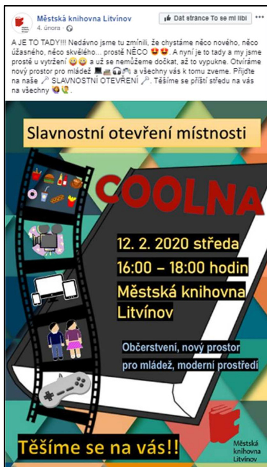
FB litvínovské knihovny (fotky ze setkání, plakát vytvořený zástupcem CS)

https://www.facebook.com/search/top/?q=knihovna%20Litv%C3%ADnov&epa=SEARCH_BOX