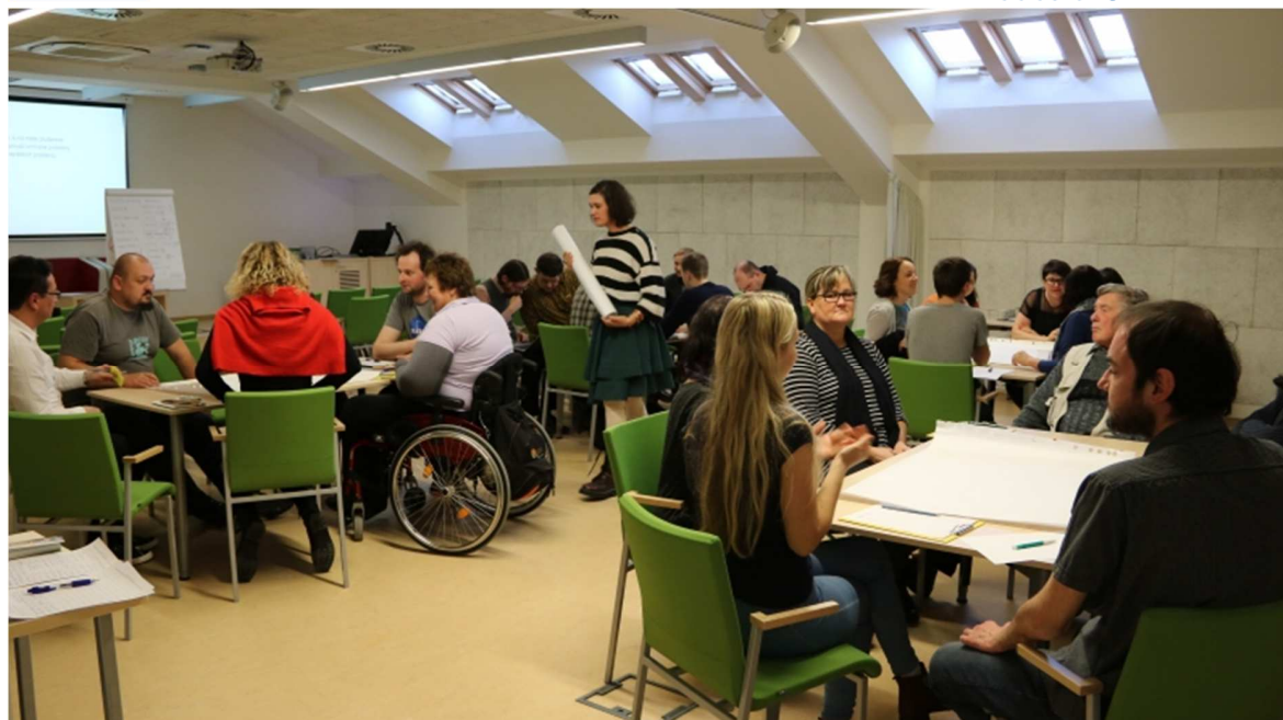
(skupinové diskuse na setkání KpBB)