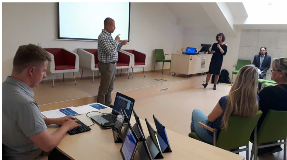
(simultánní přepis na setkání KpBB)